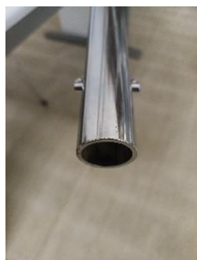
Base do Pendural